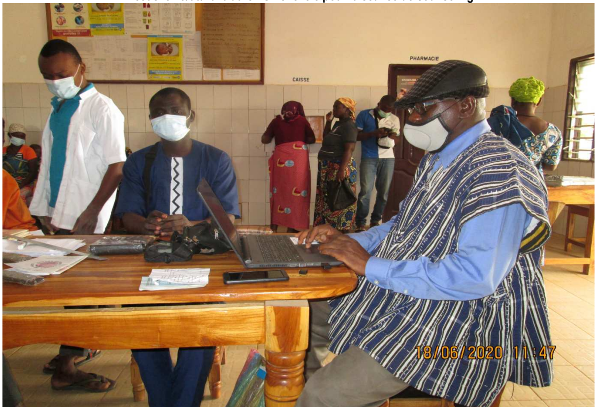
Vue des Coordinateurs du projet (Plan International Togo) et de l'ONG CAV lors de la campagne le 18/06/2020 au CMS Tchèkèlè