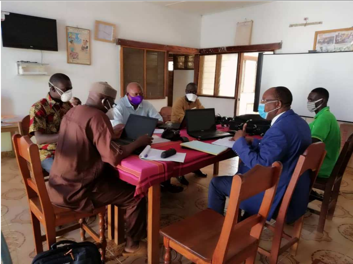
Atelier méthodologique avec les consultants en charge de l'élaboration du Manuel de procédures administrative, comptable et financière du CMS au siège de l'ONG CAV le 22/05/2020