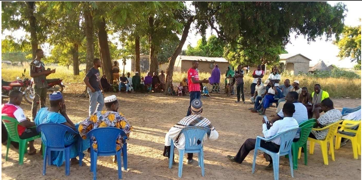
Campagnes électorales pour l'Election des membres du COGES le 04 Décembre 2019