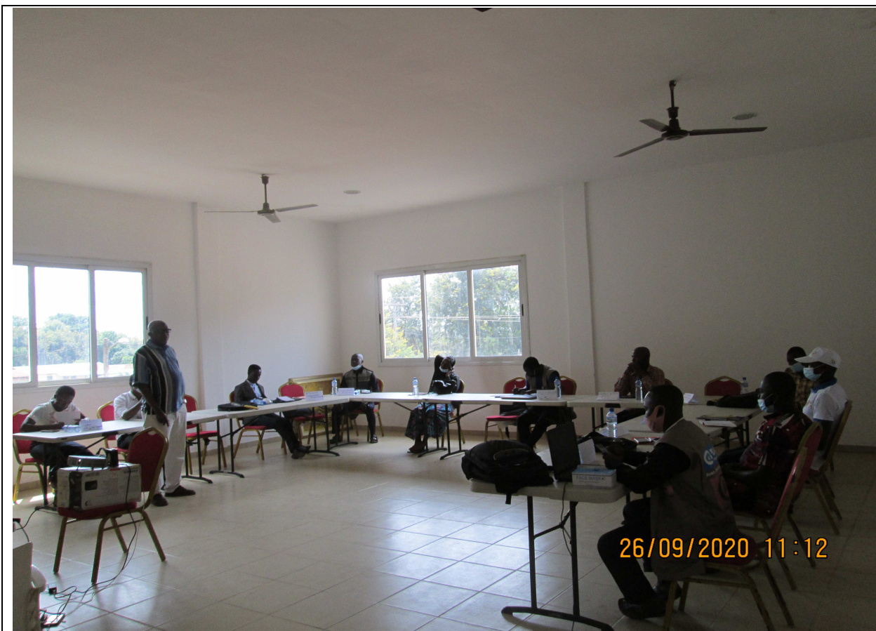
Atelier de formation du personnel du CMS Tchèkèlè et des membres de l'ONG CAV sur l'utilisation du Manuel de procédures administratives, comptables et financières du CMS Tchèkèlè , organisé du 25 au 26 Septembre 2020 au Centre des Spectacles et des Loisirs de Tchamba.