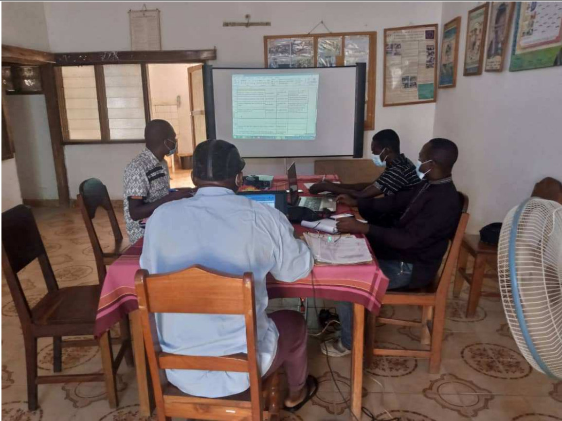
Une des réunions mensuelles de planification des activités au siège de l'ONG CAV à Sokodé