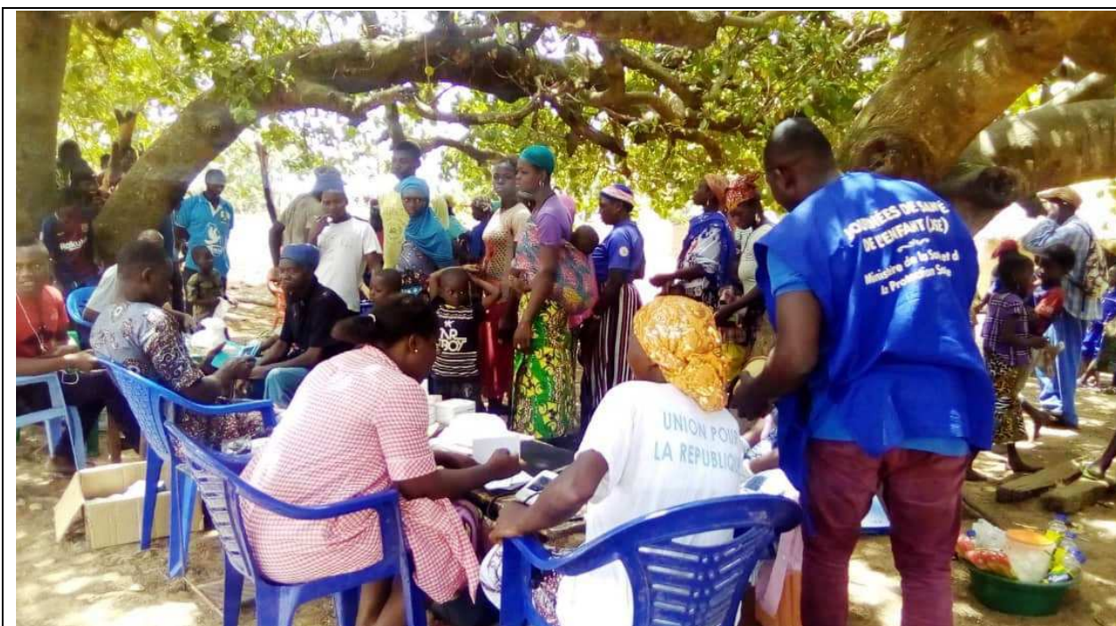
Campagne d'aide sociale pour la prise de tension artérielle, du contrôle de la glycémie, de la CPN et du déparasitage systématique des enfants de moins de 5 ans à Oudjomboi le Mercredi 04 mars 2020