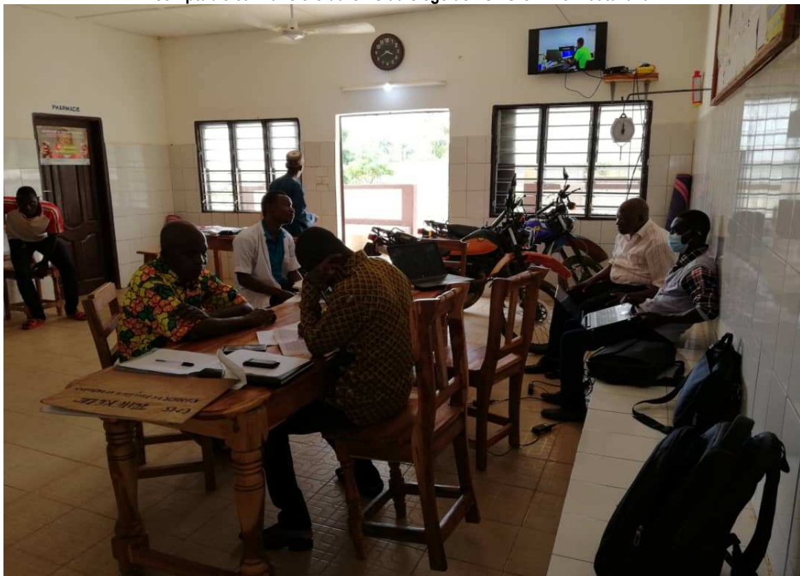
Le cabinet UAC en séance de collecte d'informations auprès des agents de santé du CMS Tchèkèlè les 26 et 27/05/2020