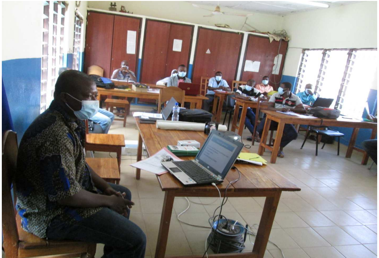
Vue des membres du COGES avec les deux (2) formateurs de la DPS Tchamba le 04/06/2020 à la DPS Tchamba