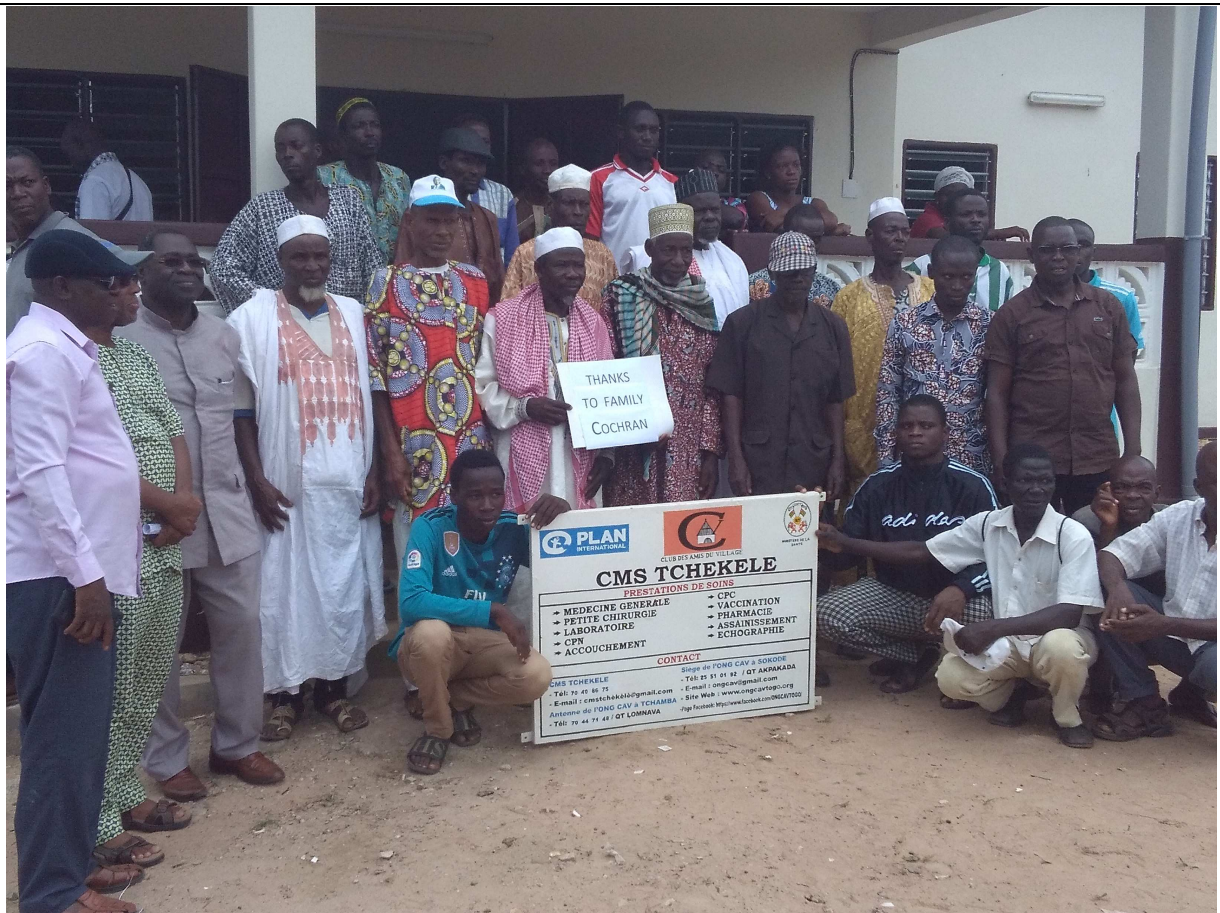
Photo de famille lors de la visite de Plan International USA à Tchekèlè le 07/08/2018