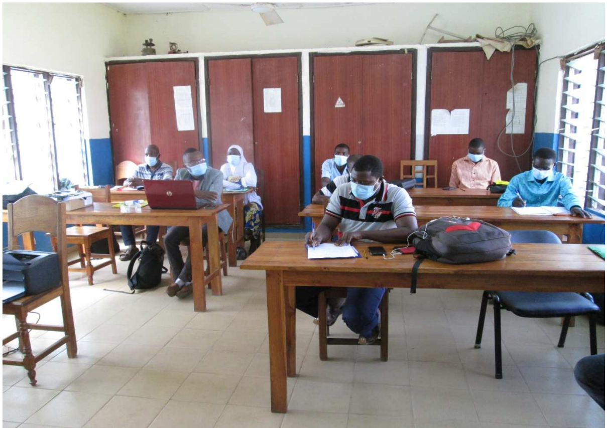
Vue des sept (7) membres du COGES lors de la formation le 04/06/2020 à la DPS Tchamba