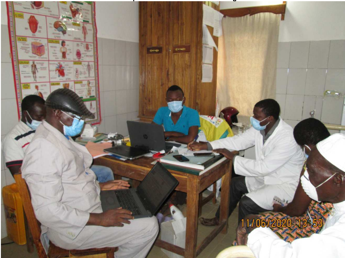
Réunion de préparation de la campagne gratuite de dépistage de l'Hépatite B et au groupage Rhésus organisée avec le personnel de santé du CMS Tchèkèlè au CMS le 11/06/2020