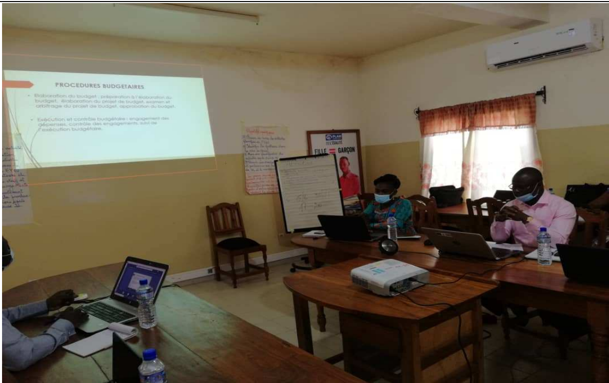
Atelier de validation du manuel de procédures du CMS Tchêkèlè et de capitalisation du projet, organisé au bureau de Plan International Togo, PU Sokodé le 20 Août 2020