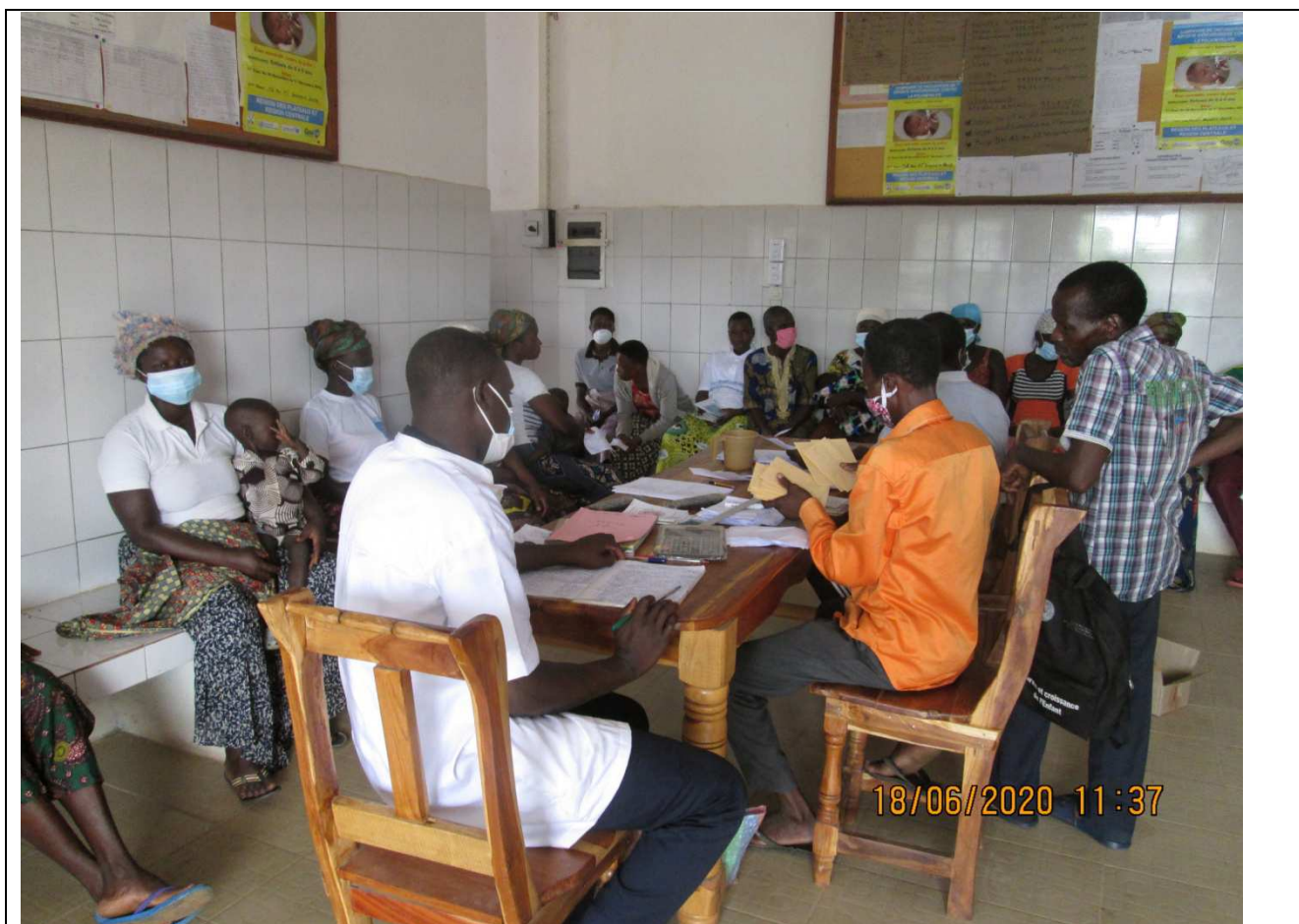
Centralisation des résultats du dépistage et laboratoire d'analyses