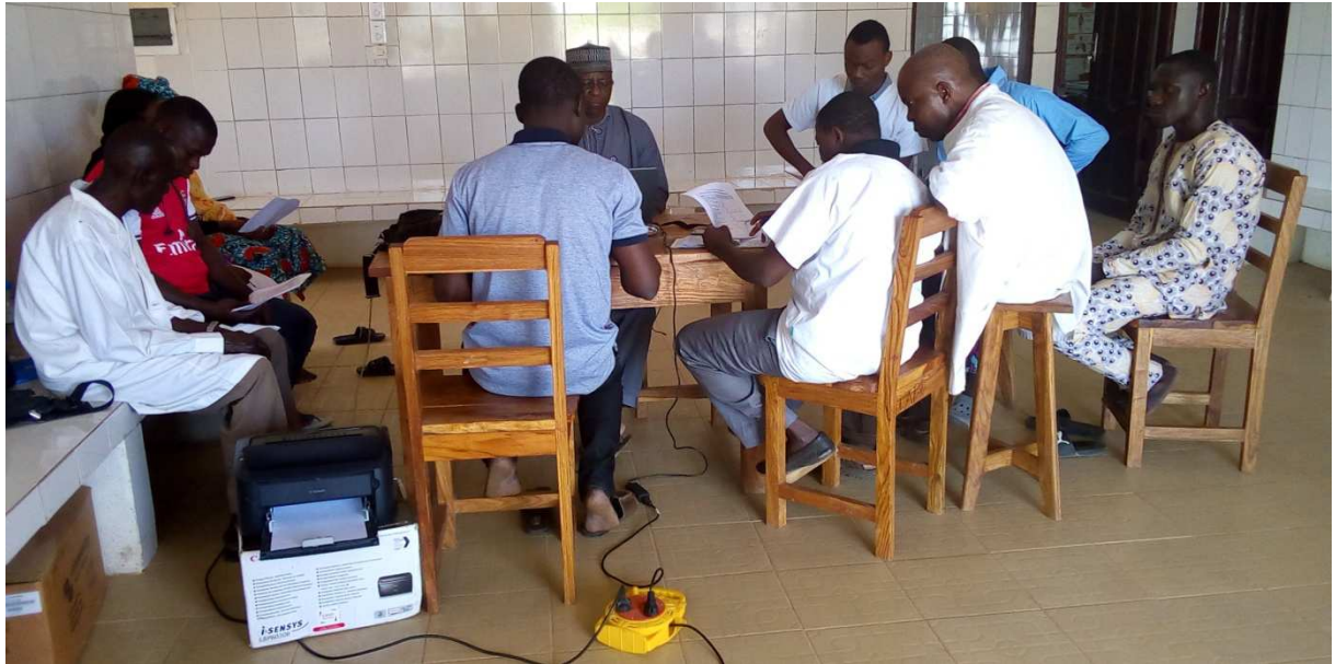
Animation du personnel du CMS et du CVD de Tchèkèlè pour la mise en place du COGES le 15 Novembre 2019