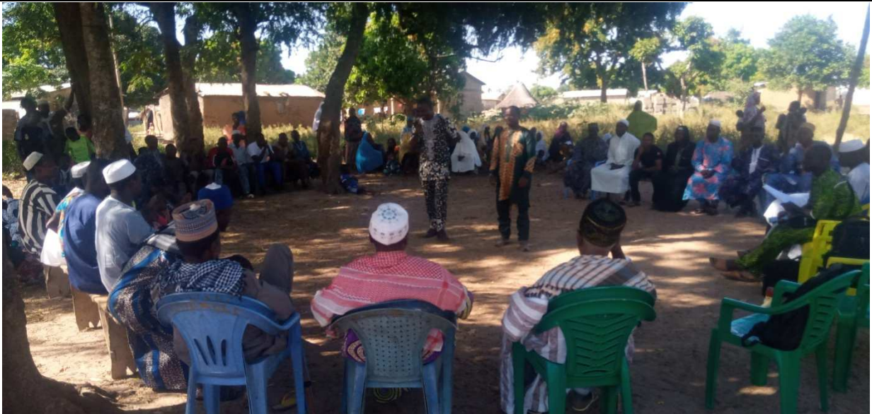
Animation pour la mise en place du COGES du CMS le 29 Novembre 2019