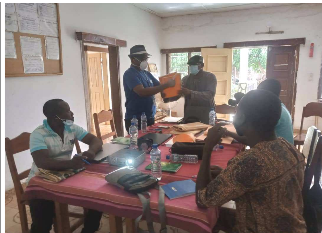
Séance d'ouverture des plis pour le recrutement d'un Consultant pour l'élaboration du Manuel de procédures administrative, comptable et financière du CMS Tchekélé le 22/04/2020