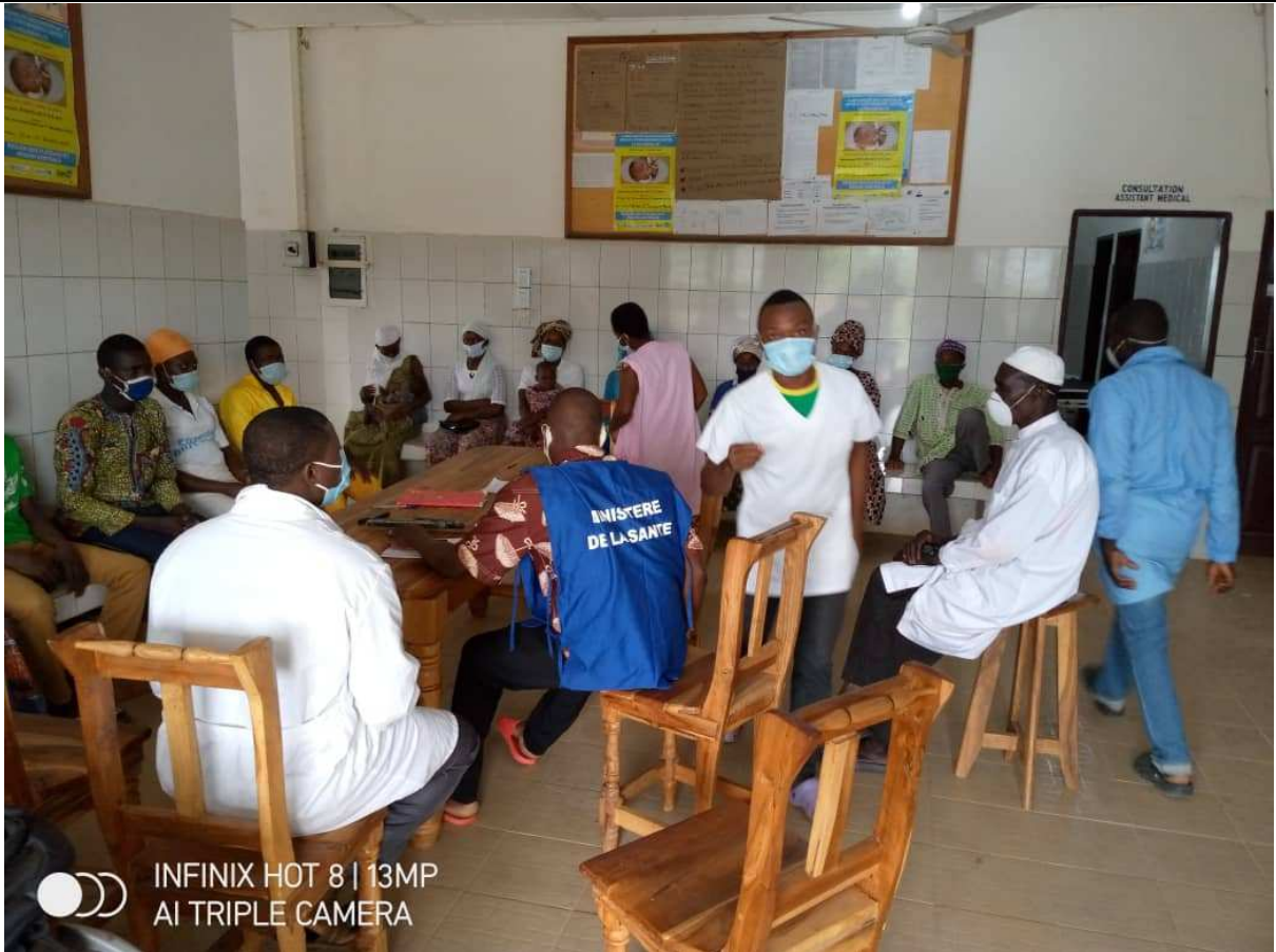
Vue des agents de santé du CMS et les participants à la campagne sociale de dépistage de l'Hépatite B et du groupage rhésus le 13/06/2020 au CMS Tchèkèlè pour la séance de counseling