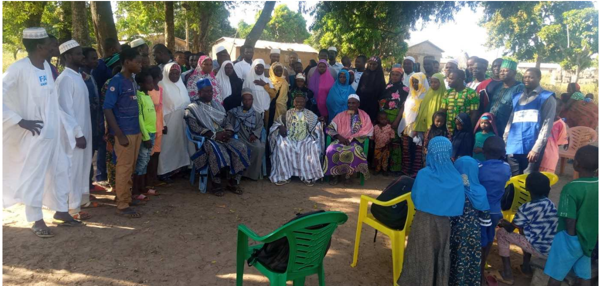
Photo de famille après l'animation communautaire pour la mise en place du COGES du CMS 29 Novembre 2019