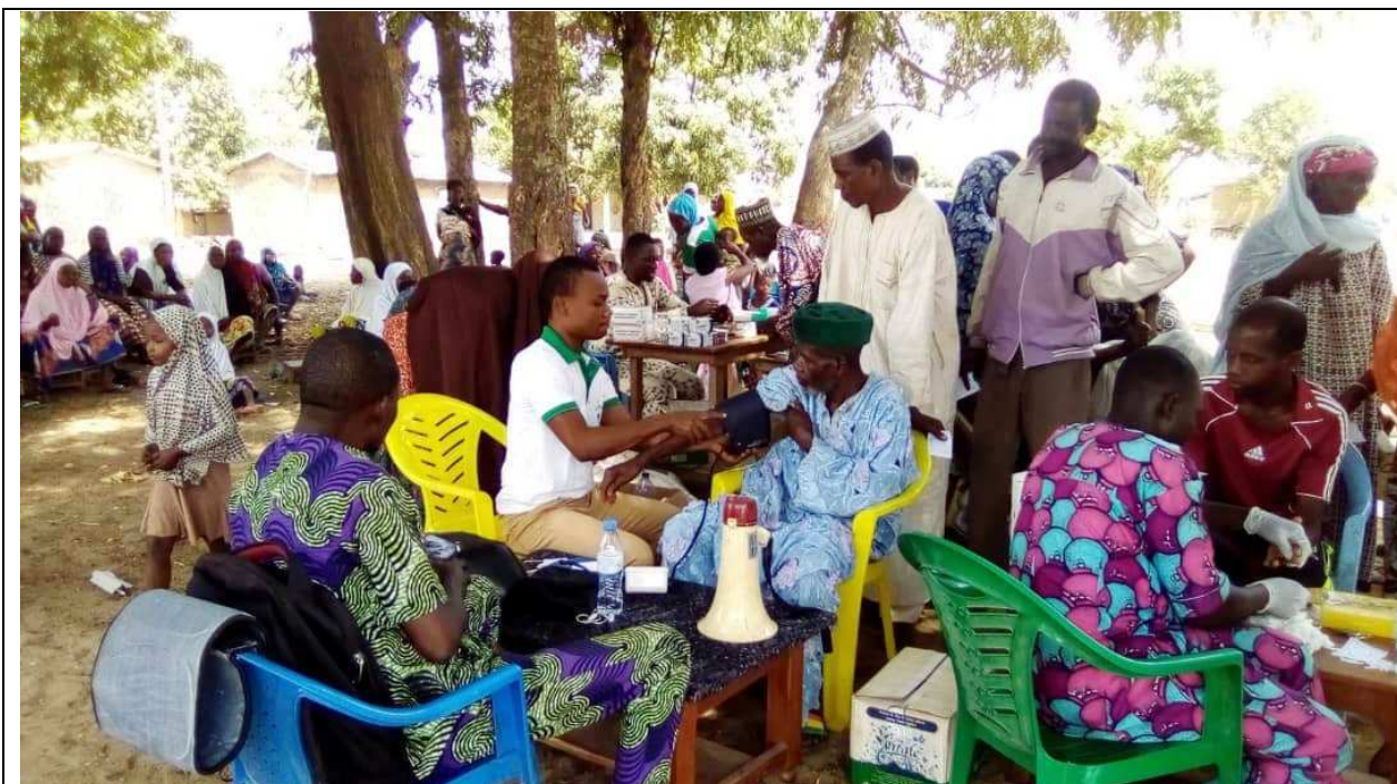
Campagne d'aide sociale pour la prise de tension artérielle, du contrôle de la glycémie, de la CPN et du déparasitage systématique des enfants de moins de 5 ans à Tchêkèlè- Peulh le Jeudi 05 mars 2020