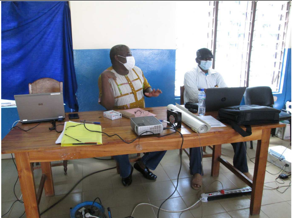
Cérémonie d'ouverture de l'atelier de formation des membres du COGES du CMS Tchèkèlè avec le DPS Tchamba le 04/06/2020 à la DPS Tchamba