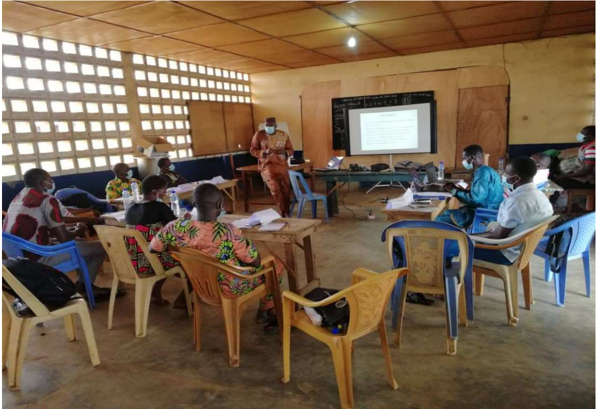
Atelier de formation du personnel du CMS Tchèkèlè et des membres de l'ONG CAV sur les services conviviaux au Centre Polyvalent de Tchamba tenu les 14 au 15 Août 2020