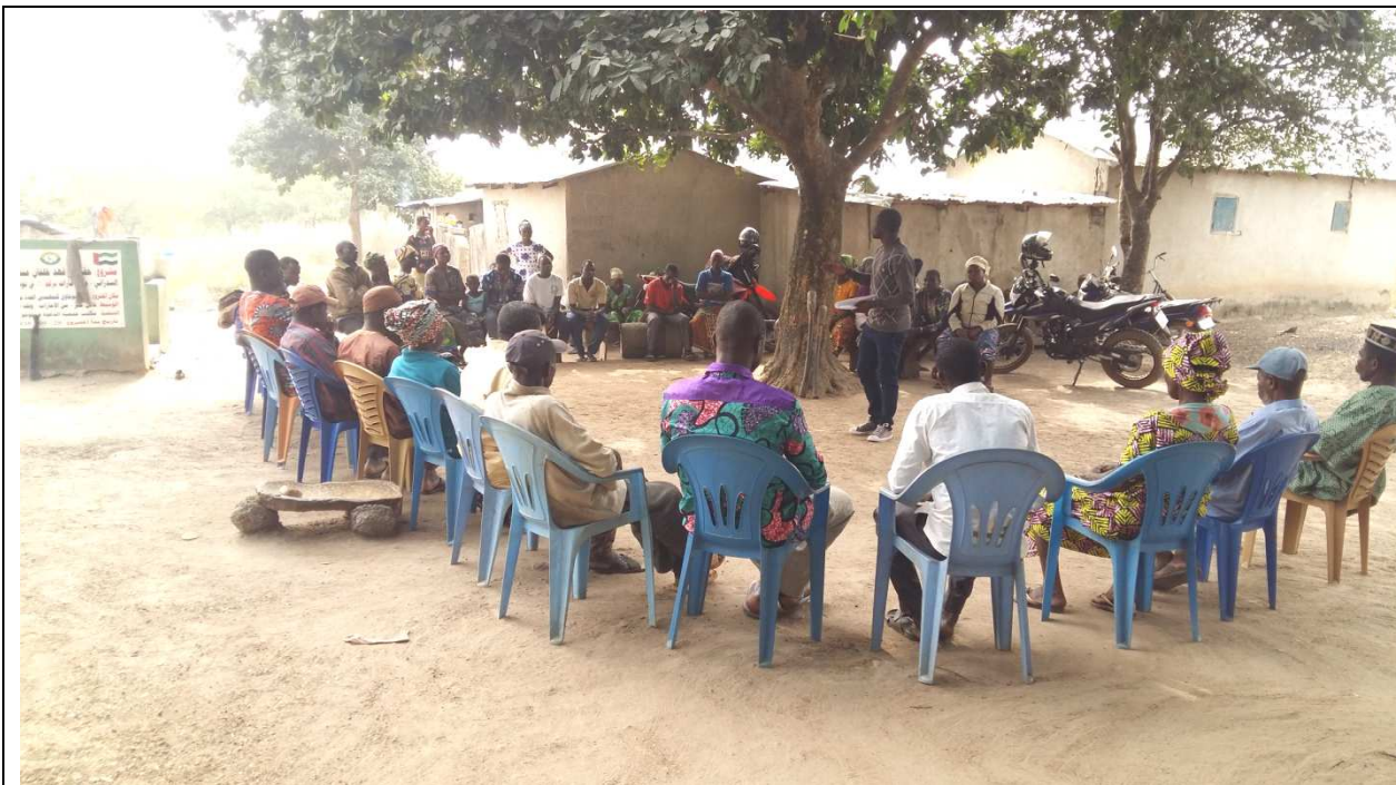
Sensibilisation des Leaders communautaires sur la fréquentation du CMS en Janvier 2020 à Omoidjawa (en haut) et à Oudjomboi (en bas)