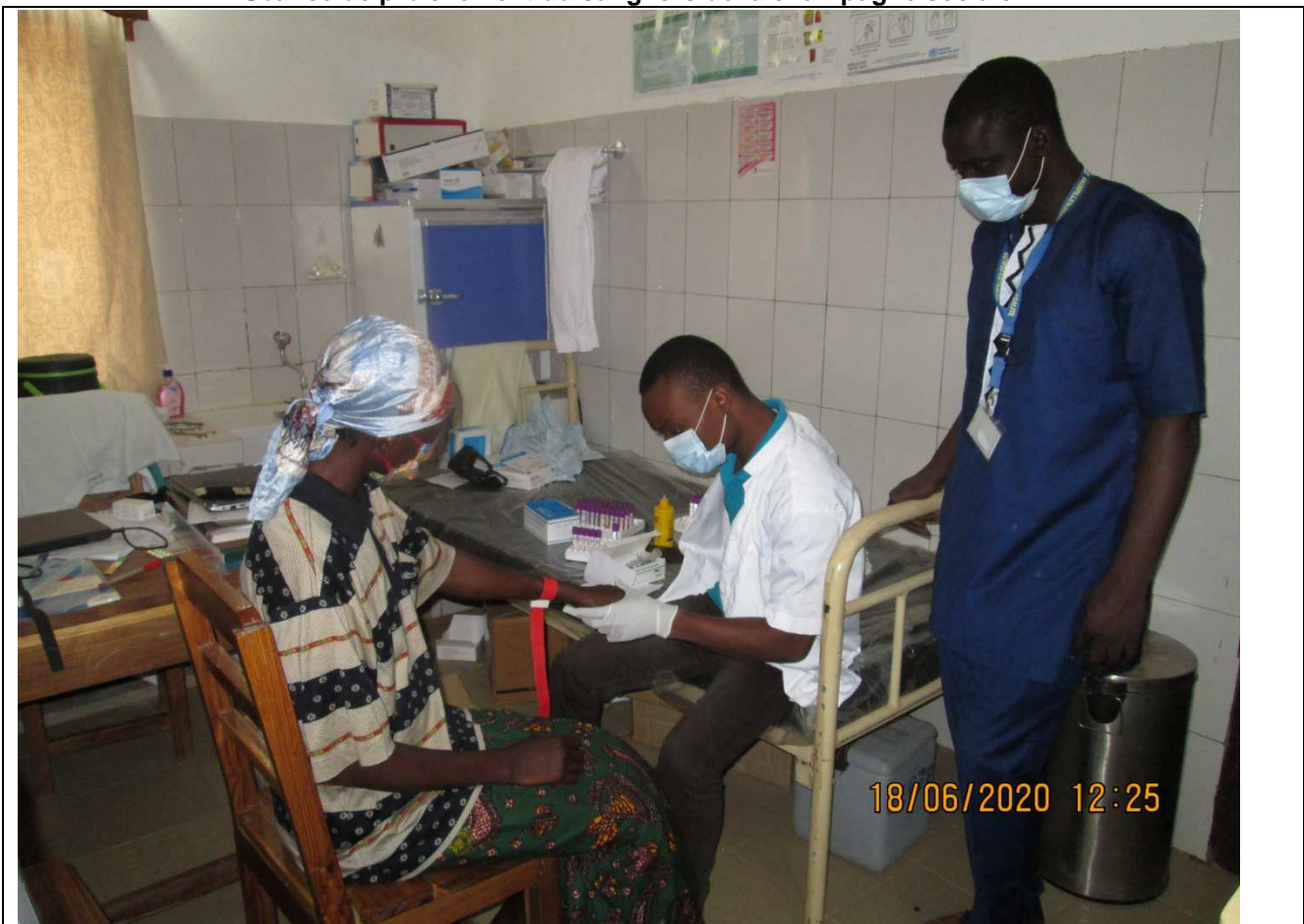
Vue du Coordinateur du projet et l'un des Animateurs de terrain lors du suivi de la campagne