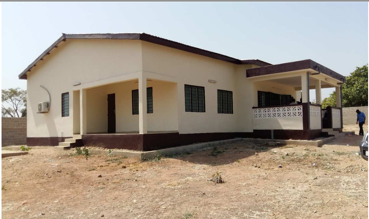
Le Centre Médico-Social de l'ONG CAV à Tchèkèlè dans le District Sanitaire de Tchamba, ouvert en Décembre 2018